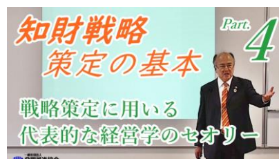
第4回 所要時間：約25分