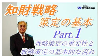
第1回 所要時間：約20分