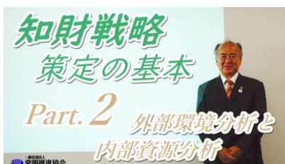
第2回 所要時間：約13分