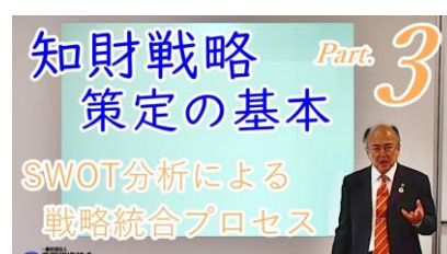
第3回 所要時間：約8分