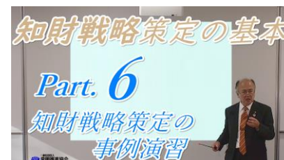
第6回 所要時間：約13分